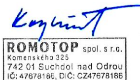
Ing. Vladimír Krajíček Product und -Innovationleiter

Bitte lesen und befolgen Sie die Aufstell- und Bedienungsanleitung! Abstände zu brennbaren Bauteilen sowie Brandschutz müssen eingehalten werden! Der Feuerstätte muss ausreichend Verbrennungsluft zuströmen können! Heizgeräte mit Wassertechnik dürfen nur in Betrieb genommen werden, wenn alle Sicherheitseinrichtungen betriebsbereit und funktionsfähig sind!